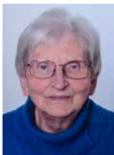
Ilshofen, im Mai 2026

Ich bin ewiges Bewusstsein und nicht der Körper. Ich bin raum- und zeitlos. Ich bin Bürger einer Welt, von der die hiesige nur ein Teil ist. Ich bin.